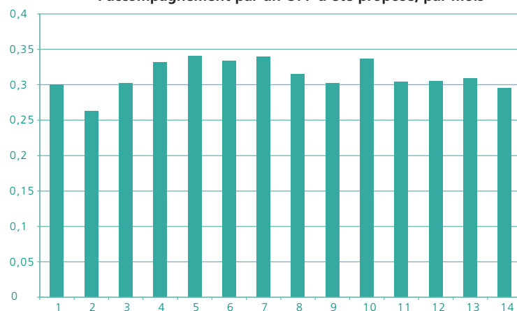
Graphique 2 • Taux d'adhésion au programme pour les jeunes à qui l'accompagnement par un OPP a été proposé, par mois

Lecture : le mois 1 est le 1 er mois au cours duquel une orientation aléatoire des jeunes éligibles a été opérée (septembre 2007), le mois 14 le dernier (octobre 2008).